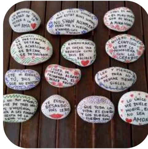
Les 100 pedres literàries