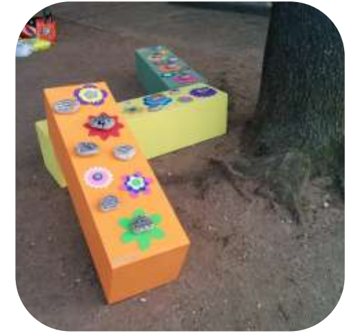
Temps de Flors 2016