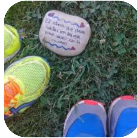
Gimcana de pedres literàries