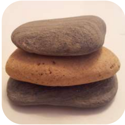
Presentación Geolittera febrero 2015